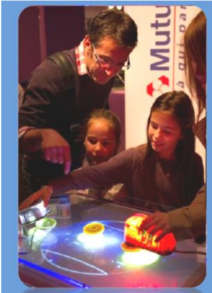
インタラクティブ:トッスピン

発色するコマを回すと、下の画面に回転数や、コマ同士がぶつかりと稲妻や炎などの演出が入ります