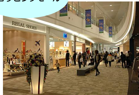
ショッピングモール