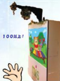
ホワイトボードタイプ