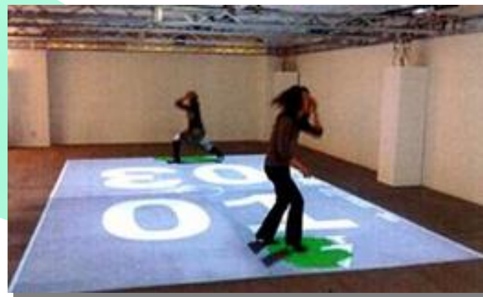
横幅7m (プロジェクター4台使用)